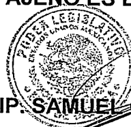
DIP. SAMUEL GURRIÓN MATÍAS. H. CONGRESO DEL ESTADO DE OAXACA LXV LEGISLATURA DIP. SAMUEL GURRIÓN MATÍAS