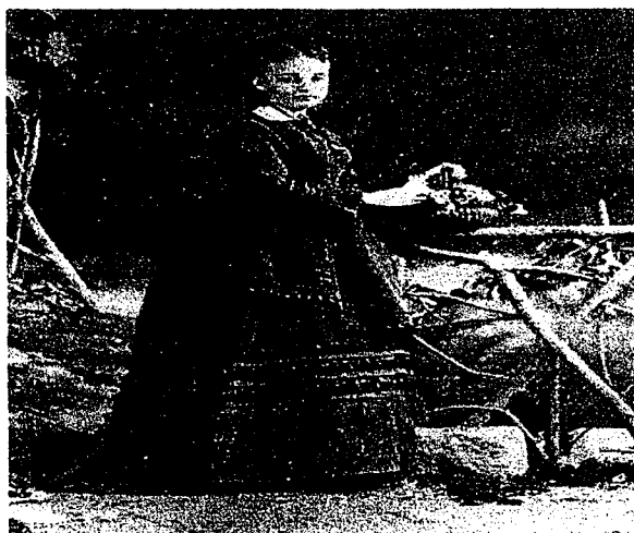
JUANA CATALINA ROMERO EGAÑA (1837-1915)